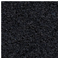
SPORTEC standard 2.0

Oberfläche: feine Granulatstruktur (auf Anfrage mit Geotextilkaschierung verstärkt)