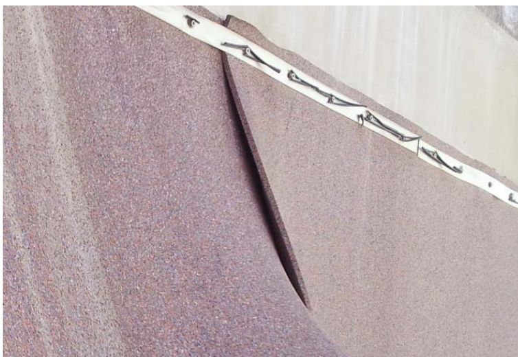
Matte mit Schraubleisten an der Wand befestigt

Die Fixierung (z.B. mit einem Schienensystem oder Klemm-/ Schraubleisten) mit Dübeln und Schrauben so an der Wand anbringen, dass diese das Gewicht der daran befestigten Schutzmatten dauerhaft tragen können.