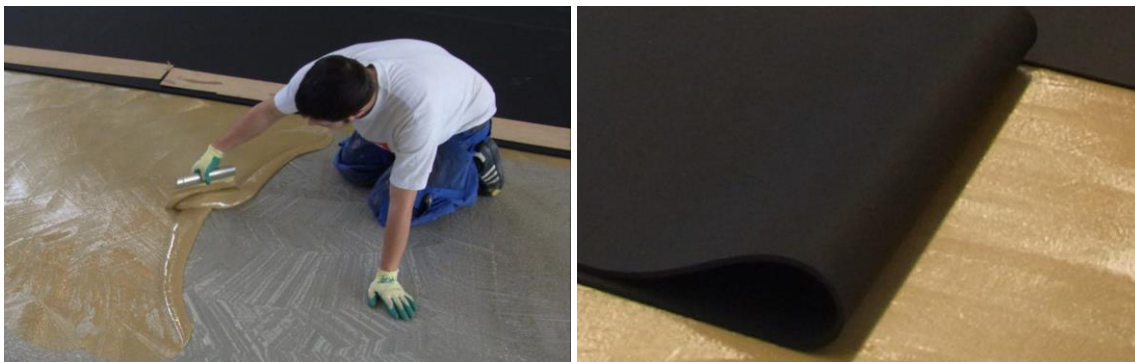
Kleberauftrag auf den sauberen Untergrund; ausrollen der Bahnen in das Kleberbett

Den Kleber mit einem Zahnpachtel gleichmäßig auf der Fläche verteilen auf der die Rolle ausgelegt wird. Für die Verlegung von SPORTEC® NRG ist ein geeigneter 2-Komponenten Polyurethan Kleber (z. B. SPORTEC 700 2K-PU Kleber) und ein Zahnpachtel mit der vom Kleberhersteller empfohlenen Zahnung zu verwenden. Anschließend wird die Rolle in das Kleberbett ausgerollt. Hierbei die Ablüftzeit / Setzzeit des verwendeten Klebers beachten.