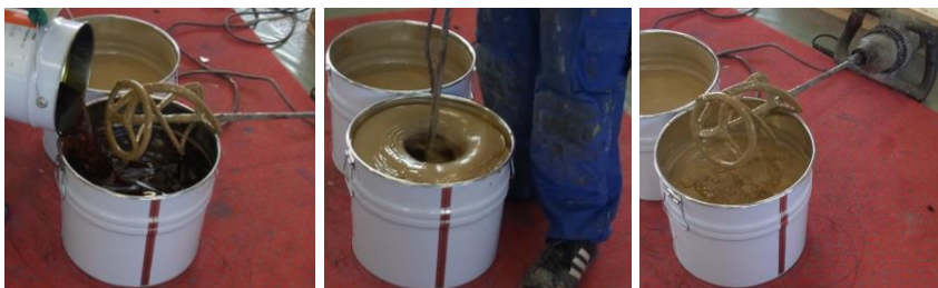
Anrühren des 2-Komponenten PU-Klebers

Der Bodenbelag wird in Rollen geliefert, welche 1-2 Tage bei einer Temperatur von 15°C bis 25°C zur Akklimatisierung dort gelagert werden müssen, wo sie verlegt werden sollen. Am Vortag der Installation den Bodenbelag lose ausrollen damit sich die einzelnen Bahnen entspannen. Vor der Installation sind die beiden Komponenten des Klebers zu mischen. Den gesamten Klebereimerinhalt direkt nach dem Mischen gleichmäßig auf die vorbereitete Installationsfläche gießen (ca. 0,7 kg/m 2 bei SPORTEC 700 2K-PU Kleber ) so dass keine Kleberreste im Eimer zurückbleiben.