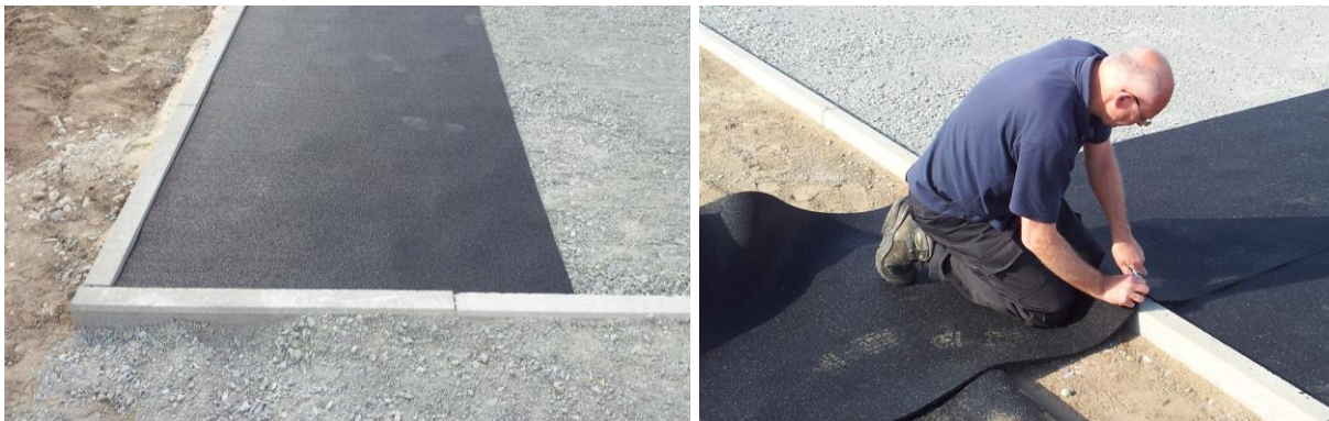
An der Randeinfassung mit der Verlegung beginnen und den Überstand abschneiden

Nachdem die Nivellierschicht normkonform vorbereitet ist kann mit dem Verlegen begonnen werden. Hierzu die erste Rolle in einer Spielfelddecke an der Randeinfassung platzieren und den Anfang der Rolle an der Randeinfassung anlegen. Dazu ein kleines Stück von der Rolle abrollen, hier reichen bereits 30-50cm aus, diesen Anfang an der Ecke der Randeinfassung platzieren und dann die Rolle gerade entlang der Randeinfassung ausrollen. Die Bahnen immer in die gleiche Laufrichtung und Stoß an Stoß verlegen, so dass keine Fuge zwischen den Bahnen bleibt. Gegebenenfalls die einzelnen Bahnen mit einem Nahtband verkleben.