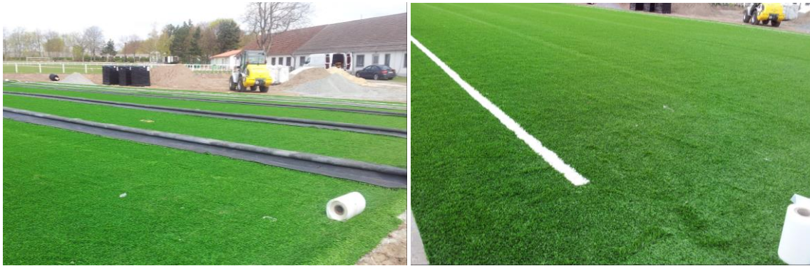
Ausrollen des Kunstrasenbelages und Verklebung der Linien

Hierbei die jeweiligen Installationsanweisungen, vorbereiteten Skizzen und Pläne des Kunstrasenherstellers beachten und befolgen.