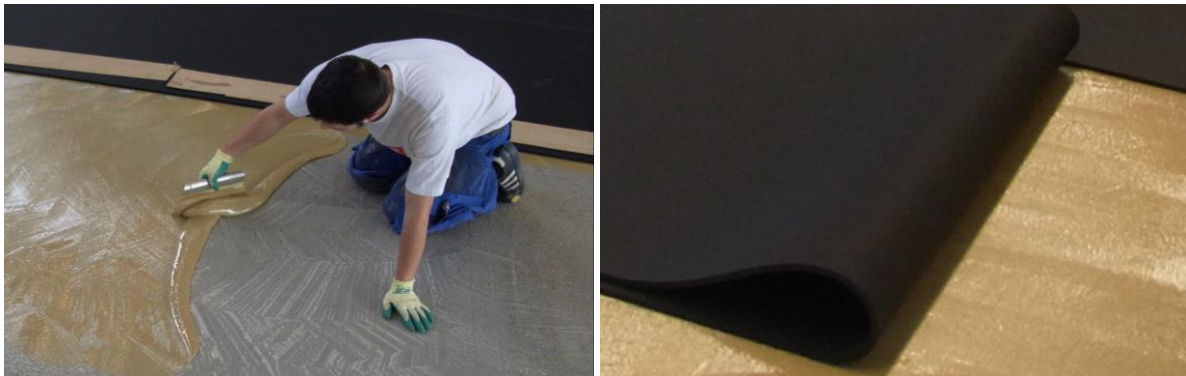
Kleberauftrag auf den sauberen Untergrund; ausrollen der Bahnen in das Kleberbett

Für die Verlegung von SPORTEC® Elastikschichten ist ein geeigneter 2-Komponenten Polyurethan Kleber (z. B. SPORTEC 700 2K-PU Kleber) zu verwenden. Den Kleber mit einem Zahnpachtel gleichmäßig auf der Fläche verteilen, auf der die Rolle ausgelegt wird. Anschließend wird die Rolle in das Kleberbett ausgerollt. Es sind die Verarbeitungshinweise und Angaben (z.B. Zahnung, Verarbeitungszeit, usw.) vom jeweiligen Hersteller des verwendeten Klebers zu beachten.