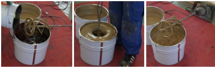
Anrühren des 2-Komponenten PU-Klebers

Direkt vor der Installation sind die beiden Komponenten des 2-K-PU Klebers zu mischen. Den gesamten Klebereimerinhalt direkt nach dem Mischen gleichmäßig auf die vorbereitete Installationsfläche gießen (ca. 0,7 kg/m 2 bei SPORTEC 700 2K-PU Kleber ), so dass keine Kleberreste im Eimer zurückbleiben. Immer nur so viel Kleber anmischen, wie in der Verarbeitungszeit verwendet werden kann.