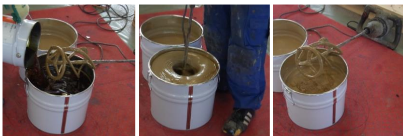
Mélange de l'adhésif PU bi-composant

La couche élastique est fourni en rouleaux qui doivent être stockés pendant 1 à 2 jours à une température de 15 à 25 °C pour s'acclimater à l'endroit où ils seront posés. La veille de l'installation, déroulez la couche élastique sans le coller afin que les rouleaux individuels puissent se détendre. Mélangez les deux composants de l'adhésif avant la pose. Immédiatement après le mélange, verser uniformément tout le contenu du seau de colle sur la surface de pose préparée (environ 0,7 kg/m 2 de colle SPORTEC 700 2K-PU ) afin qu'il ne reste aucun résidu de colle dans le seau.