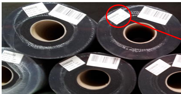
Numéro de lot

Le numéro de lot est placé sur les rouleaux à un endroit bien visible sur l'étiquette.