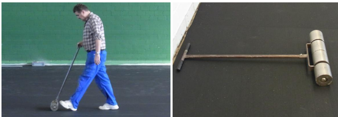
Lisser la couche élastique à l'aide d'un rouleau de compresseur

Après avoir collé la couche élastique, mais avant que l'adhésif n'ait complètement durci, appliquez une pression avec un rouleau compresseur pour faire sortir les petites bulles sous de revêtement.