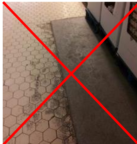
revêtement de sol inadapté