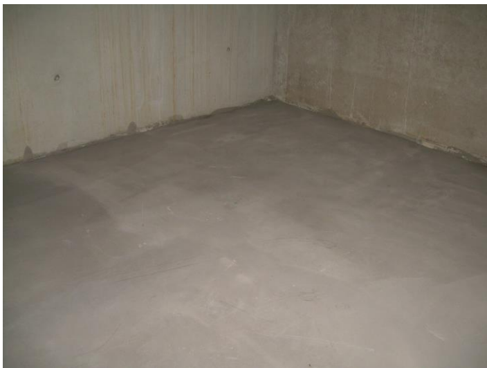
Support lisse et approprié de la chape ou béton;

En fonction du support, il peut être judicieux de le préparer avec un apprêt approprié.