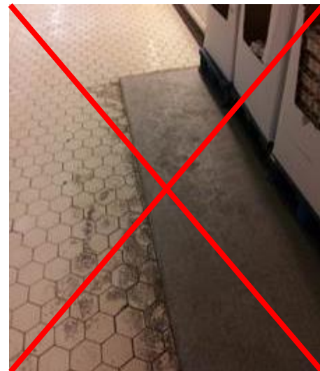
revêtement de sol inadapté