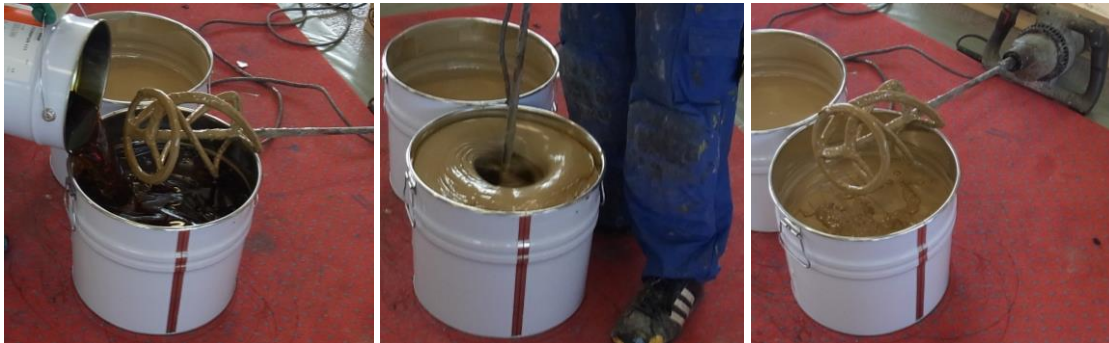
Mélange de l'adhésif PU bi-composant

Immédiatement après le mélange, verser uniformément tout le contenu du seau de colle sur la surface de pose préparée (environ 0,7 kg/m 2 de colle SPORTEC 700 2K-PU ) afin qu'il ne reste aucun résidu de colle dans le seau.