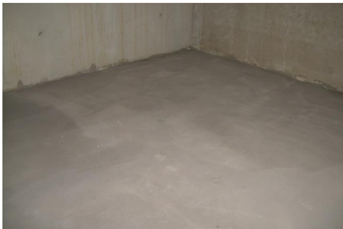
Support lisse et approprié de la chape ou béton ;

Les surfaces asphaltées et en béton ainsi qu'un sol de chape coulée conviennent comme substrat. Le support doit être plat, solide, sec, propre et exempt de saleté et de fissures susceptibles de nuire à l'adhérence.