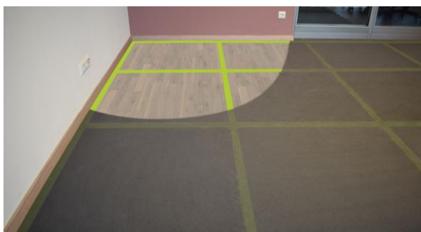
en 6mm : collage la zone d'emboîtement et la zone de bordure