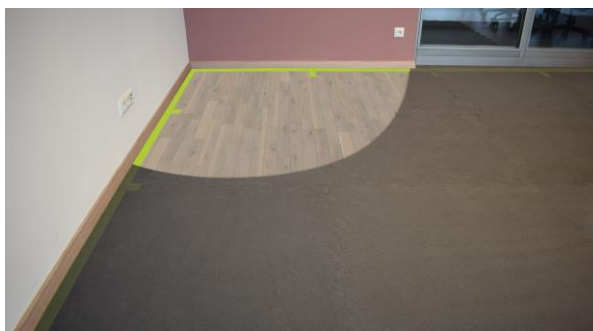
en 8-10mm : collage la zone de bordure ou lors de la découpe

La tapis de puzzle avec ses dents environnantes crée un lien stable lorsqu'elle est posée. Cependant, il faut veiller à aligner correctement les dents d'un tapis de puzzle, car chaque côté du tapis de puzzle est différent.