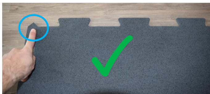
Alignement: mettre le tapis de puzzle en position en le tournant ou en le retournant