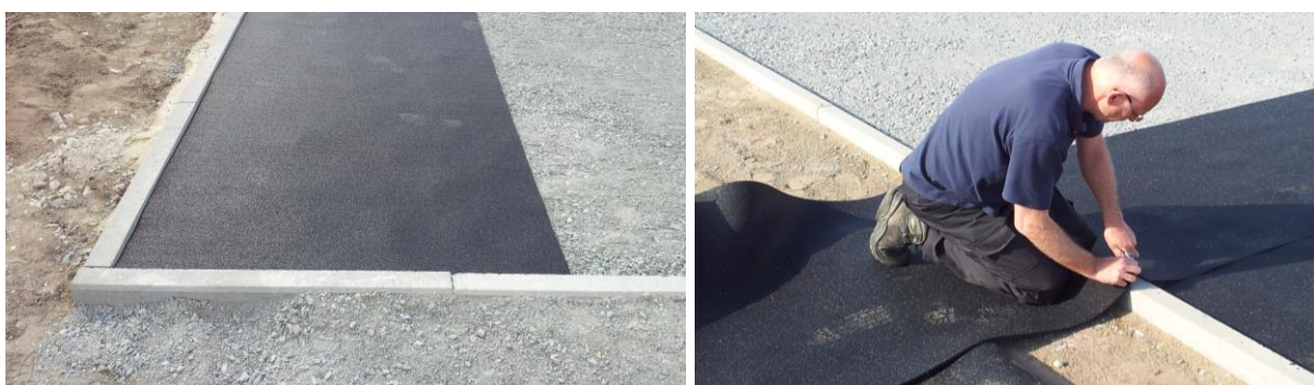
Commencer par l'installation à l'enceinte de bord et couper le surageant

Placer ce rôle début dans le coin ou au bord de l'enceinte, puis rouler le rôle justement, respectivement rouler sur la bordure le long.