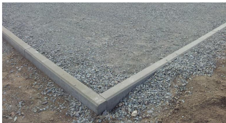
Le terrain compacté avec l'enceinte de bord

La couche élastique est livré en format de rouleau et devrait être stocké à température ambiante pendant 1-2 jours avant installation 15°C à 25°C afin d'assurer l'acclimatation correcte au chantier. Le jour avant d'effectuer la pose, il faut dérouler les rouleaux dans le sens de l'installation afin que les rouleaux puissent « se relâcher ».