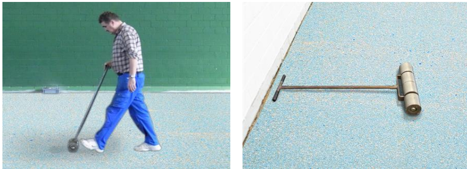
加圧ローラーによる床の圧着

床材を接着した後、接着剤が完全に硬化する前に床材の表面をローラーで圧力をかけ、材料の下に閉じ込められた気泡を除去してください。