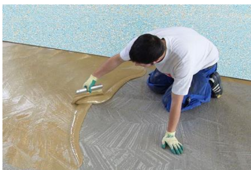
清潔な下地に接着剤を塗布する様子