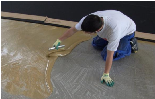
清潔な下地に接着剤を塗布する様子