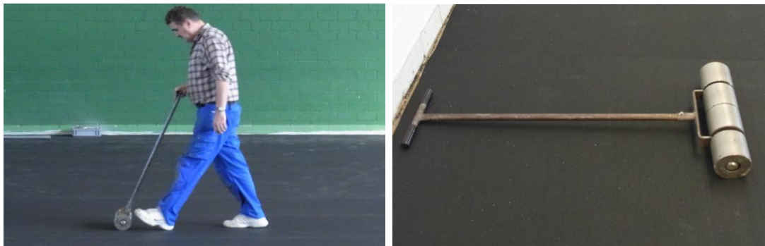
加圧ローラーによる床の圧着

床材を接着した後、接着剤が完全に硬化する前に床材の表面をローラーで圧力をかけ、材料の下に閉じ込められた気泡を除去してください。