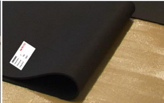
接着剤塗布面に敷設する様子

ロールは下地に裏面がくるように敷設してください。(裏面にラベルとステッカーが付いています)。そして、まっすぐ敷設してください。毎回同じ方向に材料をロールアウトし、隣り合っている部分の間に隙間がないように、隣接する端部を互いに面一にして配置します。