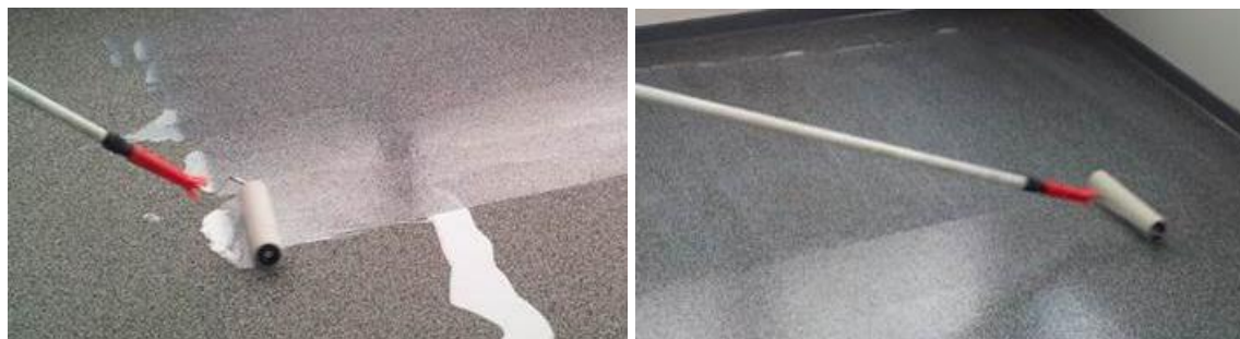
コーティング方法

用途に応じて、フローリングは RZ ターボプロテクトゼロシーリングでコーティングする必要があります。一般に屋内で床材を使用する場合は、材料をコーティングする必要があります。